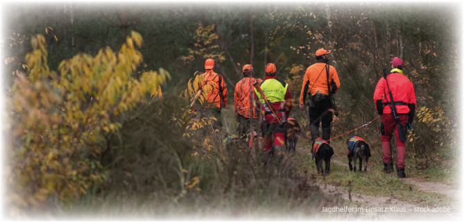
Jagdhelfer im Einsatz