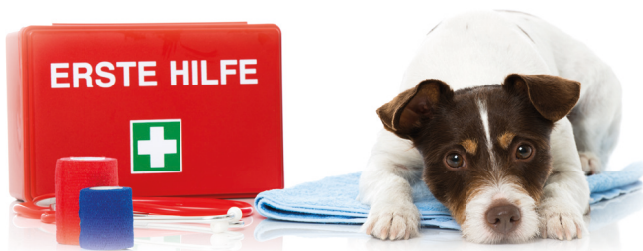
Erste Hilfe beim Hund