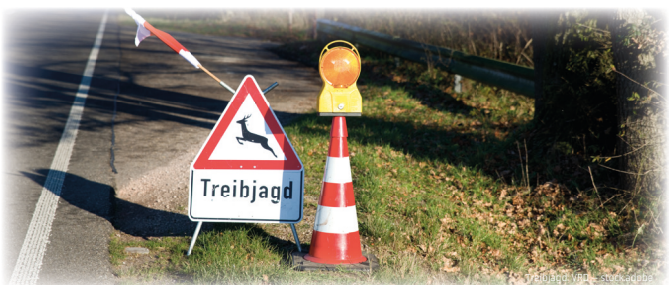
Treibjagd: VBB - stock.adobe

Referent: Wolfgang Schultes (Polizeihauptkommissar) Online-Seminar Mi. 07.02.24 Lehtagang Nr. 24683 Online-Seminar Mi. 25.09.24 Lehtagang Nr. 24684 Beginn: 19:00 Uhr, Ende: ca. 22:00 Uhr.