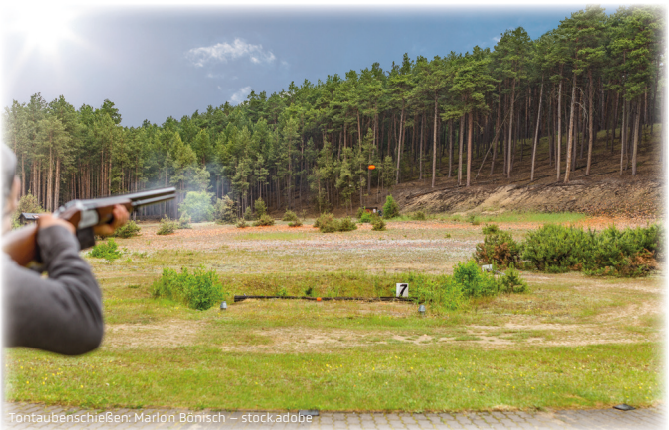
Tontaubenschießen: Marlon Bönisch – stock.adobe

Bei Fragen zur Munition wenden Sie sich bitte an den Schießstandbetreiber ( wurfscheiben-amerdingen.de ).