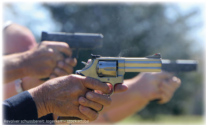
Revolver schussbereit: Jogerken — stock.adobe

Beginn: 9:00 Uhr, Ende: 15:00 Uhr, max. 12 Teilnehmer pro Kurs. Bei Fragen zur Munition wenden Sie sich bitte an den Schießstandbetreiber ( sg-steinwald.de ).