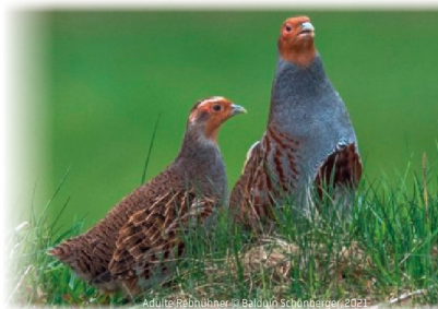
Adults Rebhühner