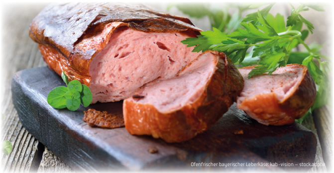
Ofenfrischer bayerischer Leberkäse; kab-vision – stock.adobe