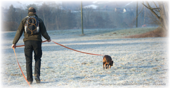
Bayerischer bei der Nachsuche: MEISTERFOTO – stock.adobe